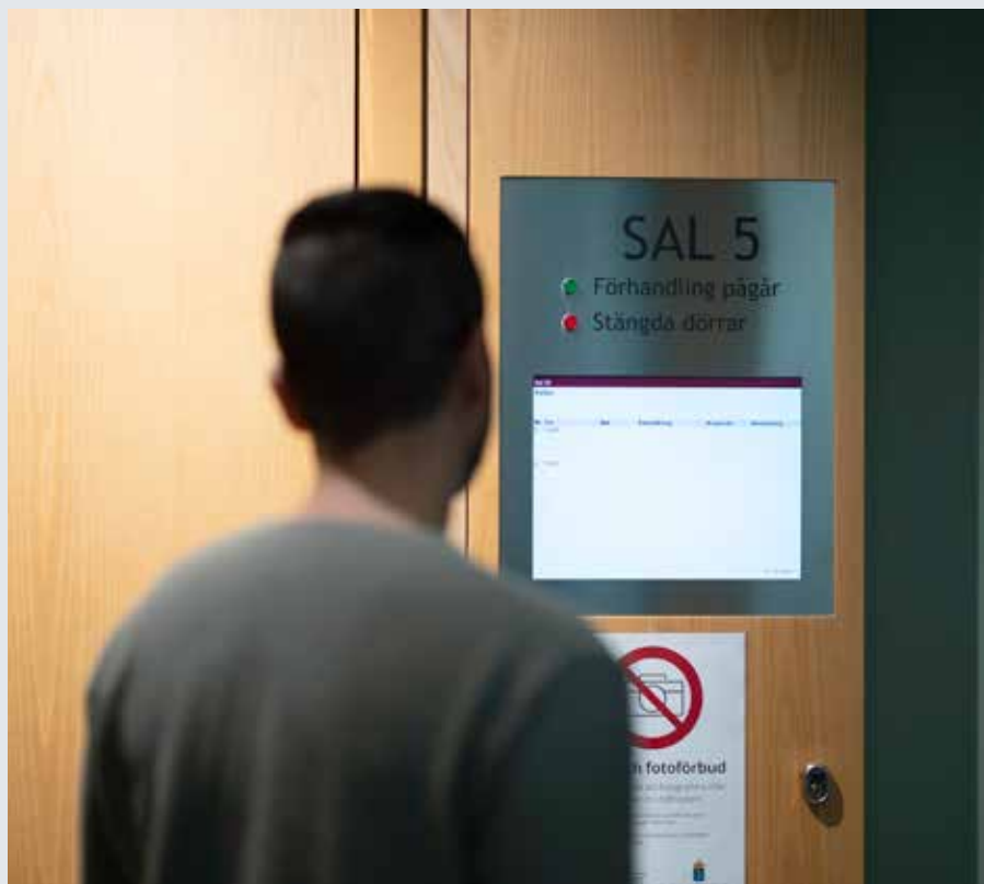
Kartläggningen inom EU-projektet COVIS visar att det finns stora skillnader i EU när det gäller domstolsstödet. Faktorer såsom förmedling, finansiering, samarbetspartners, organisationsstruktur, målgrupp, tidsramar och omfattning av stöd skiljer sig exempelvis mellan olika EU-länders organisation av stöd i domstol.

målgrupp, tidsramar och omfattning av stöd skiljer sig exempelvis mellan olika EU-länders organisation av stöd i domstol. Och även om nästan alla länder erbjuder någon form av stöd, begränsas det till exempelvis endast vissa domstolar eller specifika brottskategorier.