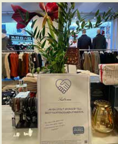
Butiken Soul4Men i Uddevalla sponsrade Brottsofferjouren och fick ett gåvodiplom som visas upp i butiken.