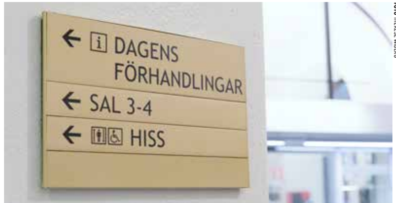
"När hålls en rättegång bakom lyckta dörrar?", undrar en frågeställare.

Fråga: Om jag blivit utsatt för brott utomlands, kan jag ansöka om brottsskadeersättning i Sverige då? Polisanmälan är gjord i Spanien då jag blev rånad och knuffad så att