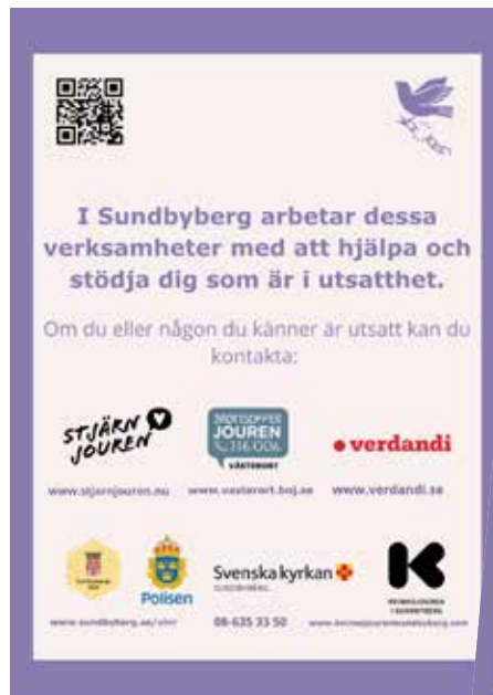
Flyern som delades ut till lokalbor i Sundbybergs kommun.

BOJ Västerort tog fram en flyer inför aktiviteterna som genomfördes.