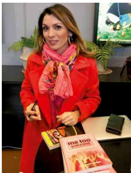
Även författaren och journalisten Alexandra Pascalidou deltog på konferensen där hon presenterade sin bok "metoo – så går vi vidare: röster, redskap och råd".