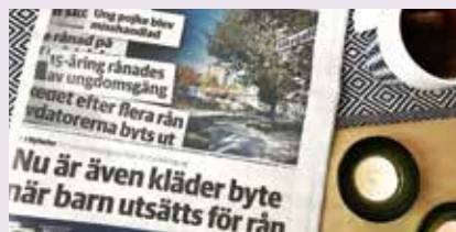
Ur artikelserien i Västmanlands Läns Tidning (VLT).

I oktober fick Brottsofferjouren Västmanlands Stödcentrum för unga vara med och delta i en artikelserie om personrån i Västmanlands Läns Tidning, VLT.