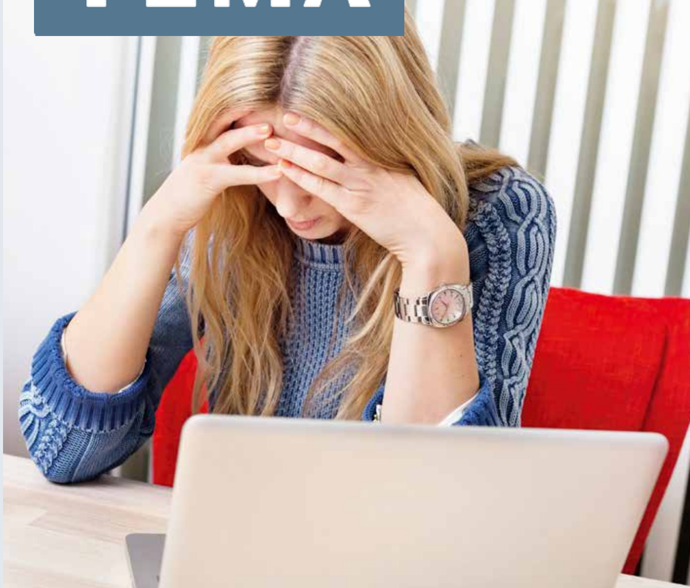
PERSONEN PÅ BILDEN HAR INGEN KOPPLING TILL TIDNINGENS INNEHÅLL