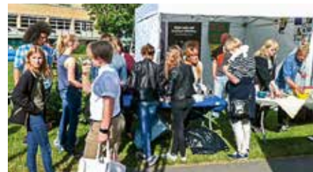
Brottsofferjournen Uppsala delade ut godis och armband till ungdomar på festival.