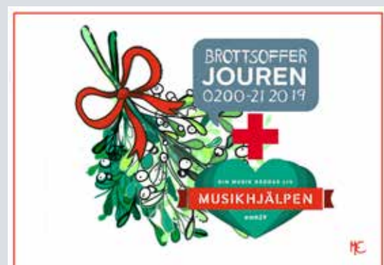
ILLUSTRATION: MATTIAS EDLUND & CAROLINA EDLUND