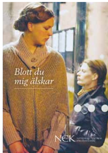
Filmen Blott du mig älskar är framtagen av Nationellt centrum för kvinnofrid. Den är en av två filmer om våld i samkönade parrelationer som har premiär i maj.

Fyra nyanser av våld har tagits fram inom ramen för det EU-finansierade projektet LARS (Lesbian Awareness Raising Strategies) som RFSL:s brottsofferjour deltar i. Filmen har utarbetats utifrån en workshop som tidigare hållits under Pridefestivalen och på utbildningar i